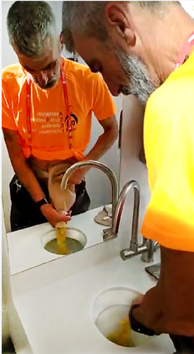
Persona ostomizada vaciando su bolsa en un baño adaptado.