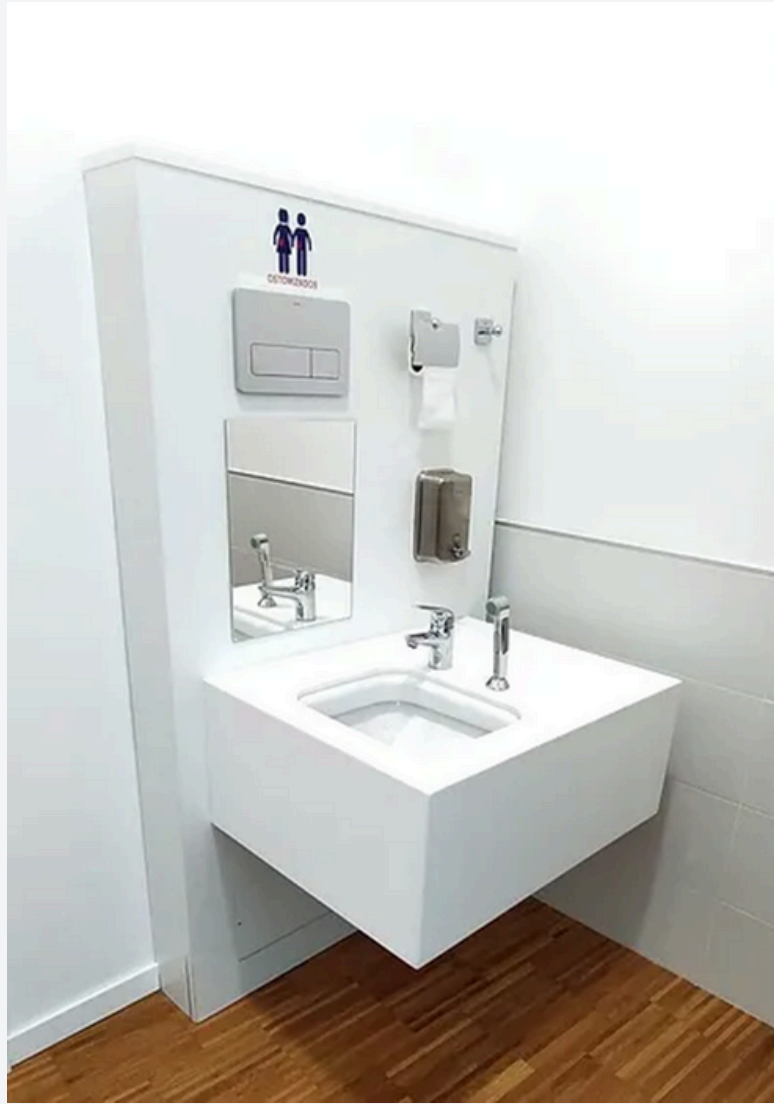
Ejemplo de baño adaptado a personas ostomizadas