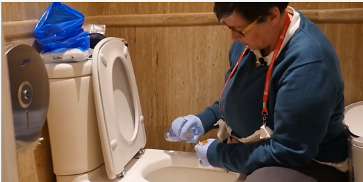
Persona agachada limpiando su bolsa de ostomía en un baño no adaptado.