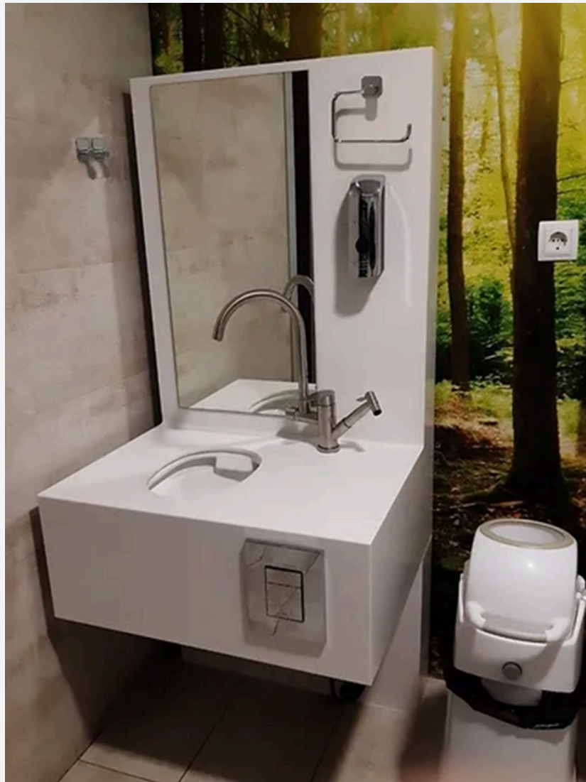
Ejemplo de baño adaptado a personas ostomizadas

Empresa Blanco y Nodar. Marca OstoBaños PontevedraTeléfono: 630 539 655 blancoynodar@hotmail.com www.ostobanos.com