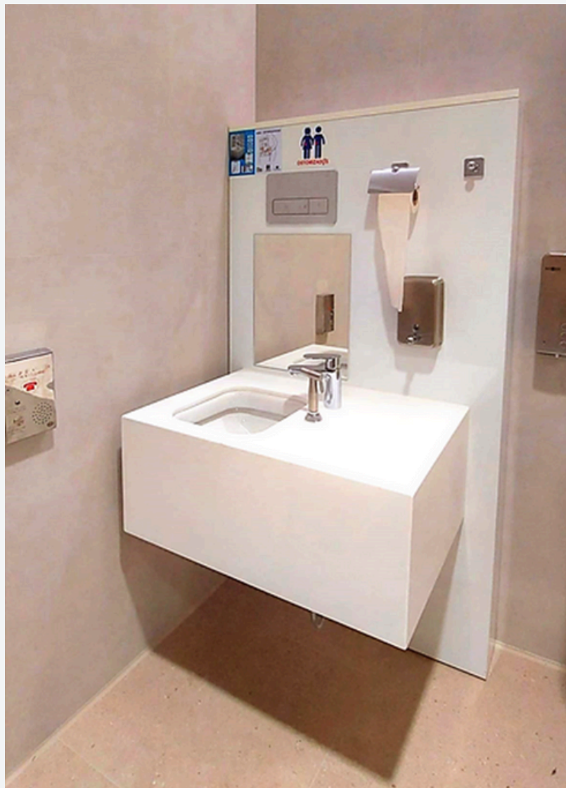
Ejemplo de baño adaptado a personas ostomizadas

Empresa LHC. Marcas EmptyMe y BañOstom Palma de Mallorca info@lhc1.net www.lhc1.net Teléfono: 644 662 959