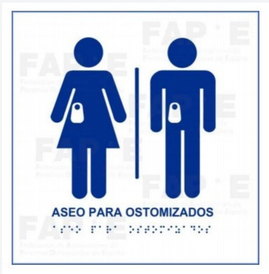
Logo a colocar en la entrada de un baño para personas ostomizadas

Señalética: se colocará visible y en relieve junto al marco de la puerta. Ver modelo abajo